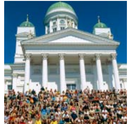
Helsinki on viime vuosina kasvattanut suosiotaan vapaa-ajan matkakohteena. Viime vuonna lomalla olleiden osuus yöpyjistä oli 47 ja kesäkaudella 55 prosenttia.

Tänä kesänä Helsinkiin odotetaan 60 kansainvälistä kongressia, joihin saapuu yhteensä 16 000 osanottajaa. Kongresseista kolme on noin tuhannen hengen kokouksia ja yksi 3000 hengen kokous, "European Association of Nuclear Medicine Annual Congress".