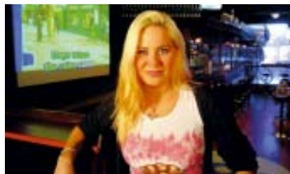
City-lehti valitsi Sansanin kaupungin parhaaksi karaoke-emännäksi vuonna 2003.

lauantaihin klo 20-03. Karokebaarin voi varata päivisin esim. kokoustilaksi. Paikan päällä on valmiina huipputekniikka, kuten äänentoisto, langattomat mikit ja DVD:t.