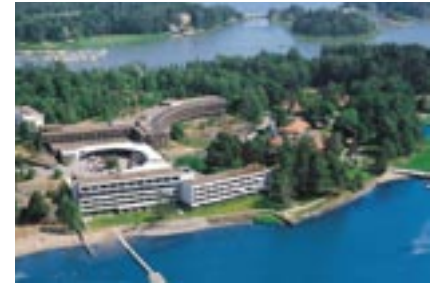
Kalastajatorppa sijaitsee hyvien yhteyksien päässä: keskustaan on vain viisi ja lentokentälle 20 kilometriä.

Rantahotellissa sijaitseva ravintola Meritorppa upeine merinäköaloinen tarjoaa suomalaisia meren herkuja ja laajan valikoiman viinejä. Päärakennuksessa asiakkaita palvelee viihtyisä lobbybaari Vista Bar &