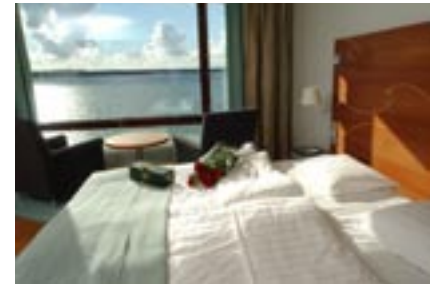
Suuremmissa Business- ja De Luxe-huoneissa on esteetön näkymä merelle.

Lounge. Hotellin yksityinen puistoalue soveltuu erinomaisesti puutarhajuhliin ja vastaanottoihin.